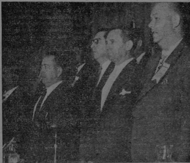
Representantes obreros mexicanos y extranjeros presidiendo en el Auditorio "Carrillo Puerto", de la CTM, en la ciudad de México, el acto inaugural de la Conferencia Interamericana de la Alimentación.