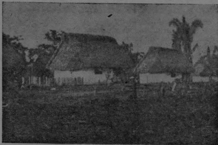
Una de la región sureña de México, donde la campaña antipalúdica se encuentra en pleno desarrollo.