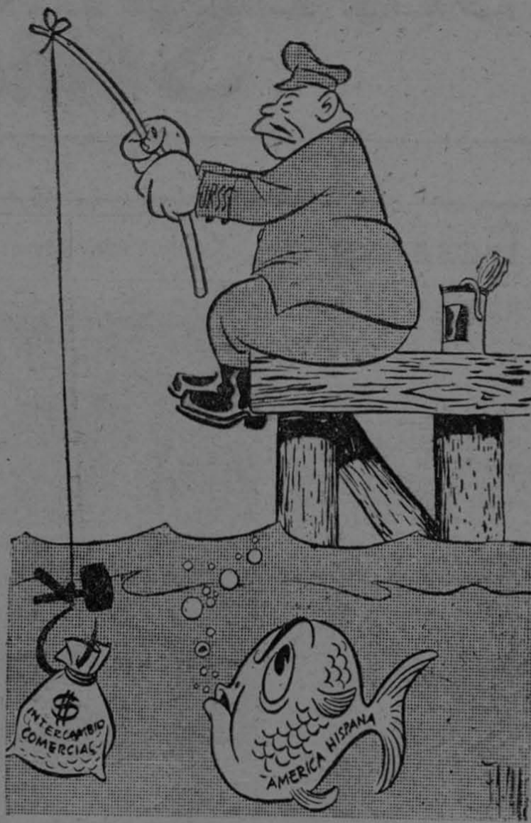
Tras la carnada está la coexistencia. De "ULTIMAS NOTICIAS", de la ciudad de México.